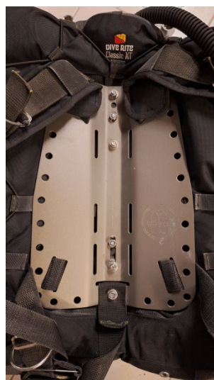
Montage sur une plaque dorsale à l'aide des tiges filetées dia. 8 mm