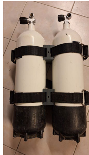
Assemblage des blocs avec le kit-bi