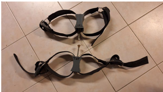
Kit-Bi en PVC et sangles Nylon

Blocs DIN identiques, même capacité, 7 à 12 litres.