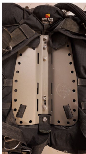
Montage sur une plaque dorsale à l'aide des tiges filetées dia. 8 mm